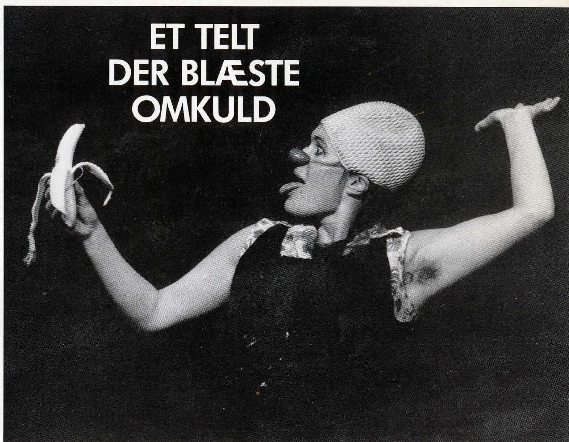
Teater i Teltet, 1984.

Måske var belønningen klapsalverne fra et fyldt telt, der bekræftede, at publi-